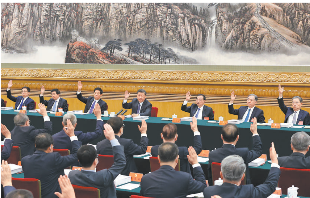
10月21日,中国共产党第二十次全国代表大会主席团在北京人民大会堂举行第三次会议。习近平、李克强、栗战书、汪洋、王沪宁、赵乐际、韩正等出席会议。