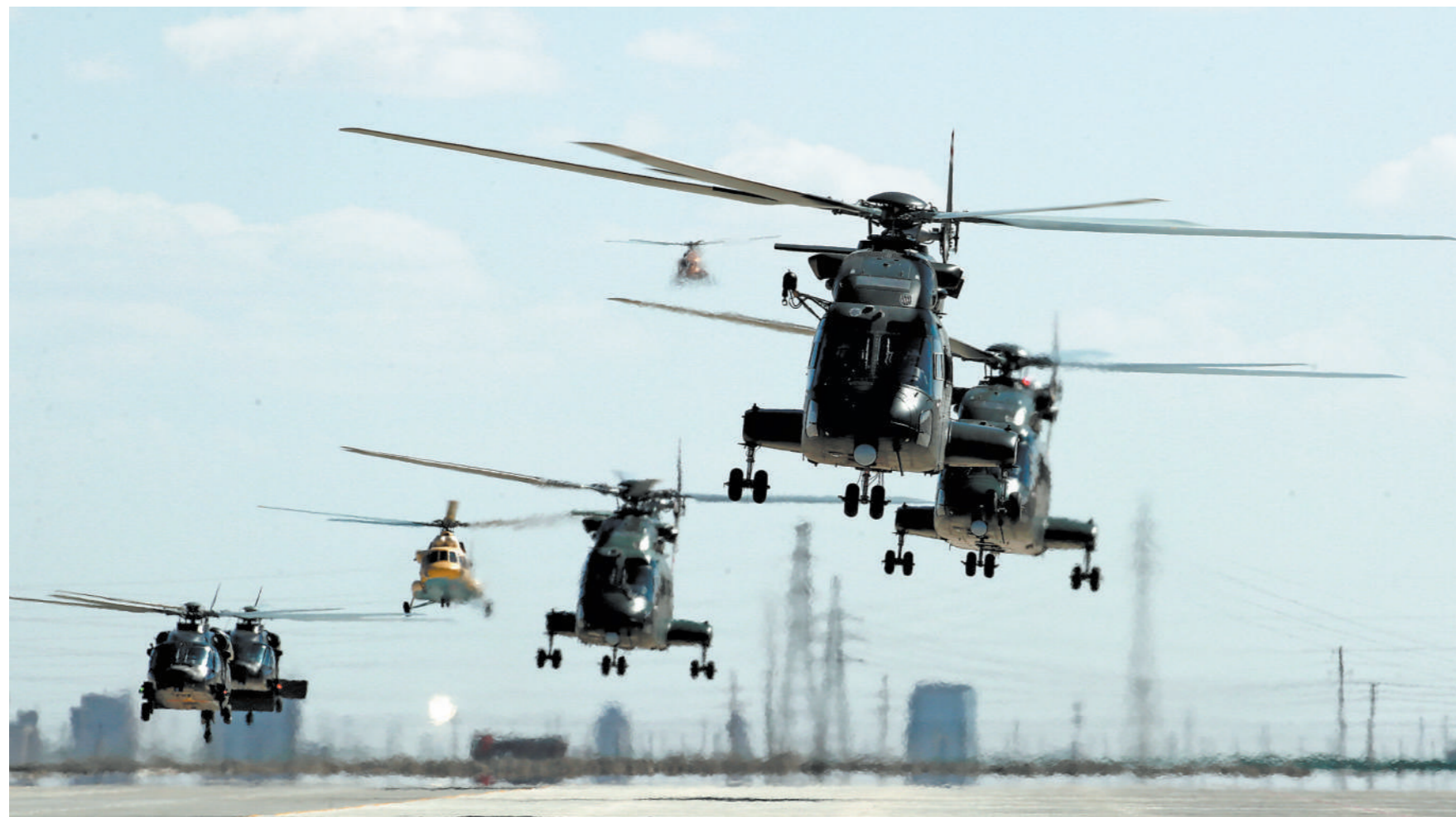
9月底，第76集团军某旅开展直升机编队训练，锤炼官兵实战能力。