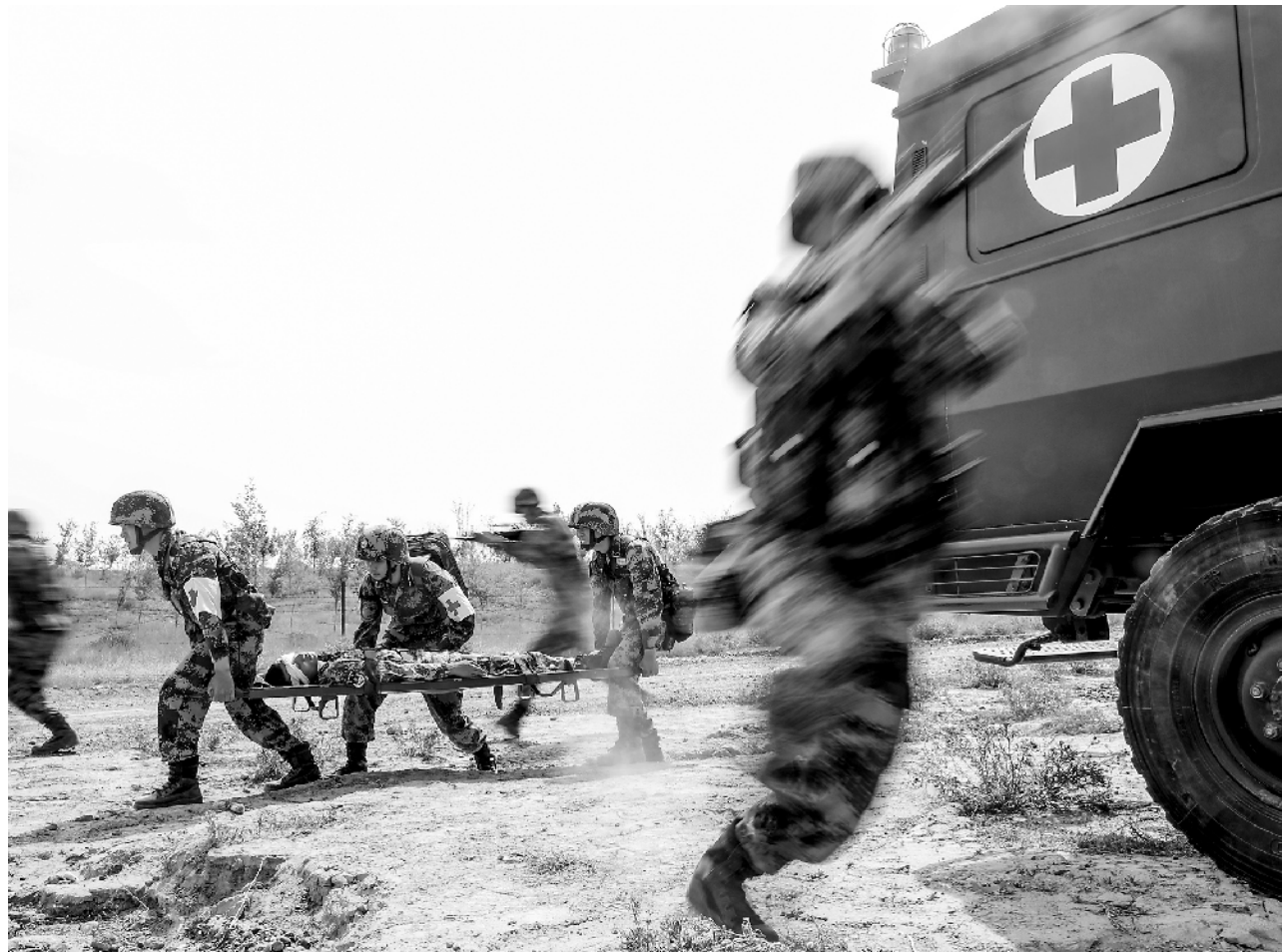
近日，新疆军区某红军团组织卫勤人员开展火线救治、战术救治等课目演练，锤炼官兵的战场救护能力。图为官兵正在转运“伤员”。