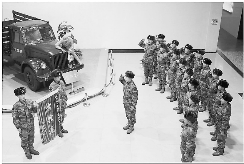
白哈达、守岛战士制作的和平鸽、航天中心的神舟飞船……每份礼物都蕴含着一个动人的故事，同时也给予官兵无穷的动力。