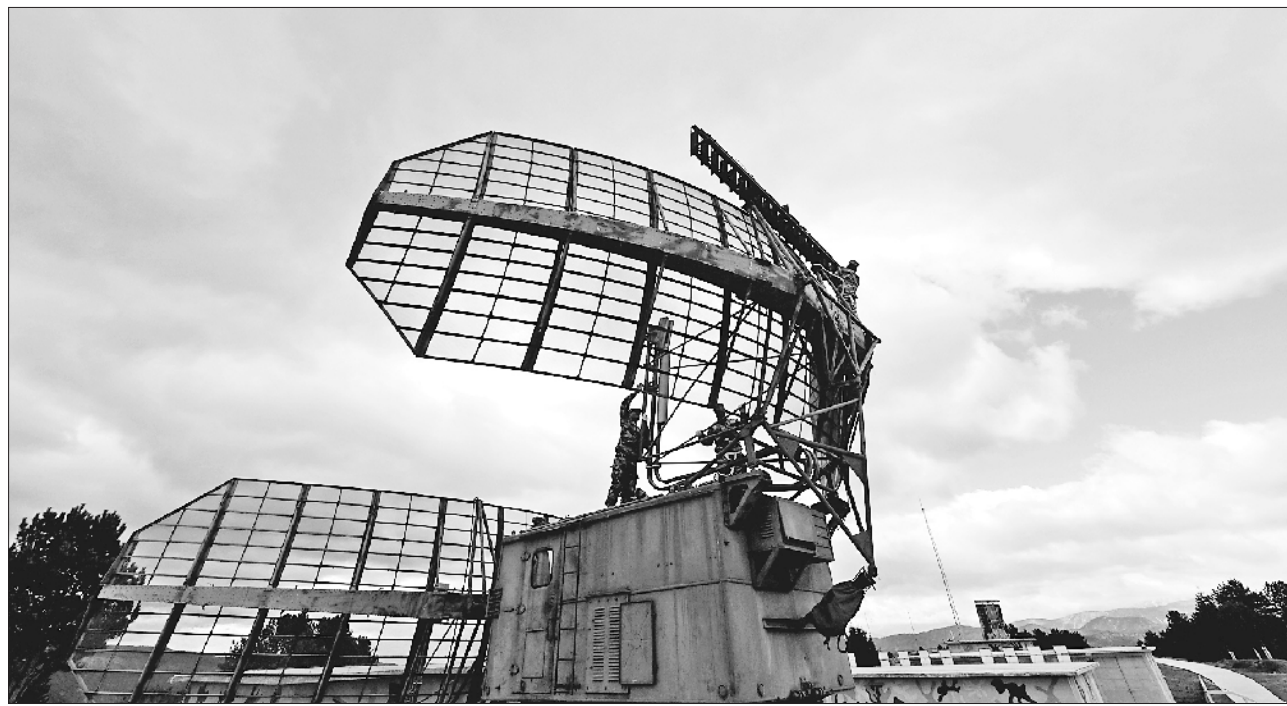
2月3日,空军某雷达站严格按照《装备检查维护规定》,组织官兵精心维护某型雷达装备,确保装备时刻保持良好状态。