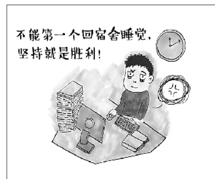
不能第一个回宿舍睡觉,坚持就是胜利!