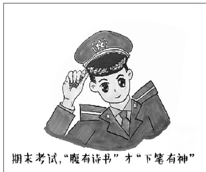
期末考试,“腹有诗书”才“下笔有神”