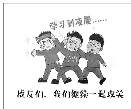
战友们,我们继续一起攻关