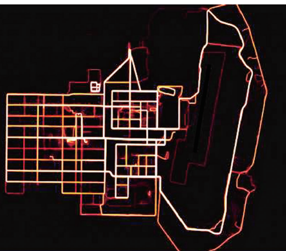
据全球热力图显示,阿富汗赫尔曼德省一座美军基地内慢跑者的运动轨迹清晰勾勒出基地的轮廓(左图);公布的地图上还包括阿富汗坎大哈的空军基地(右图)。

一款运动软件(APP)可能泄露重大军事秘密,并给美军士兵带来致命威胁!这可不是危言耸听。美国媒体近日纷纷报道称,全球定位系统(GPS)追踪公司“斯特瓦拉”(Strava)通过手机运动软件搜集到用户运动信息后,绘制出了一幅“全球运动热力地图”。借助这幅地图,情报专家可以轻易掌握美军及其盟友在热点地区的军事基地、日常活动和行进路线等敏感信息。